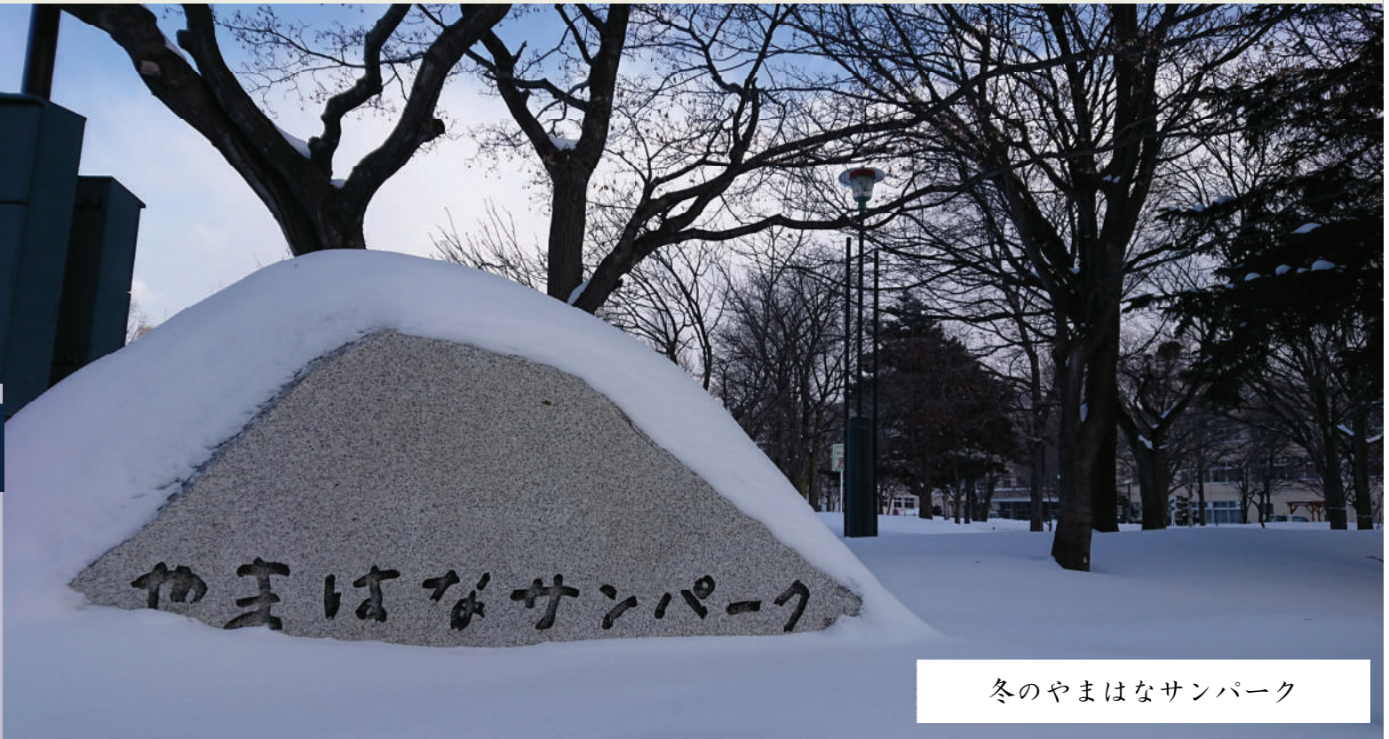
冬のやまはなサンパーク